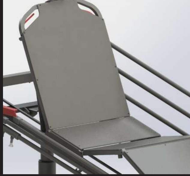
HPL Lying Surface