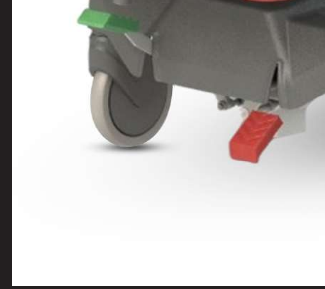
Central Locking Pedal