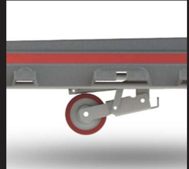
5 th Castor