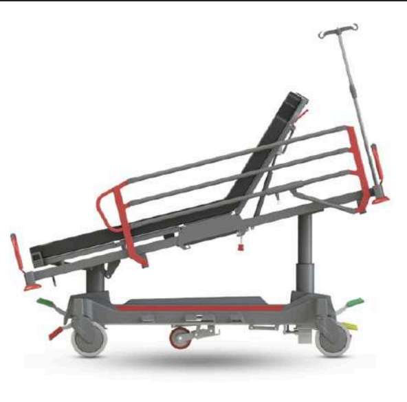
-15° Reverse Trendelenburg