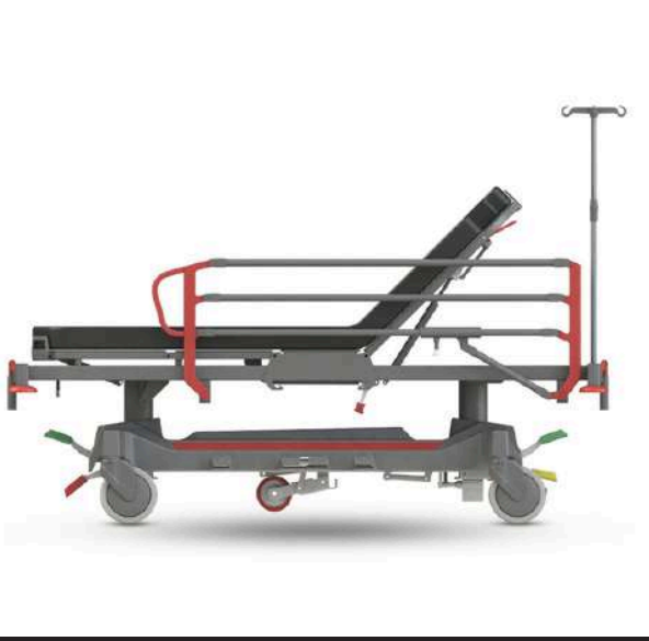
90° Backrest Movement