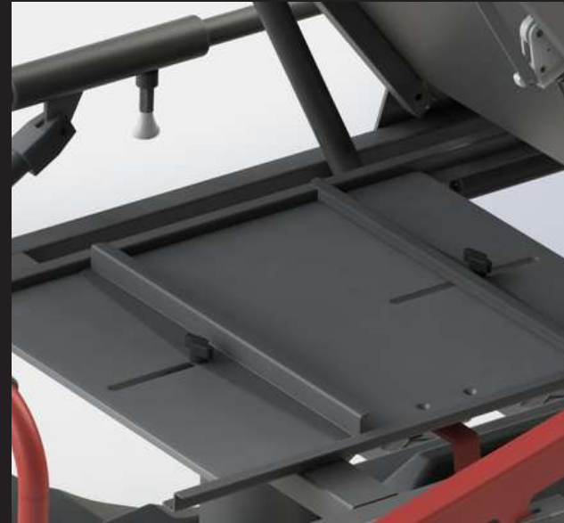
X-Ray Cassette Holder