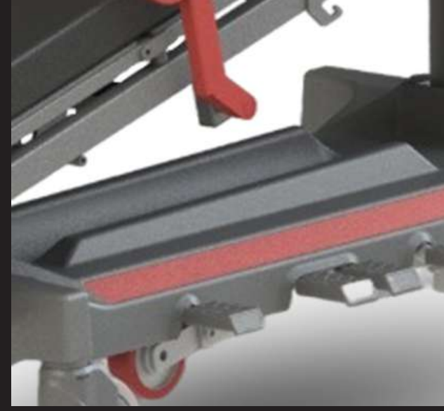
Oxygen Cylinder Holder