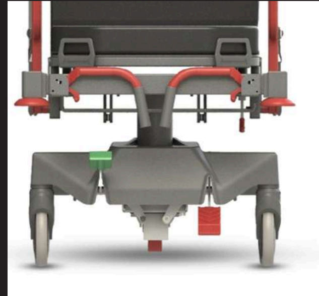
Foldable Push Bar