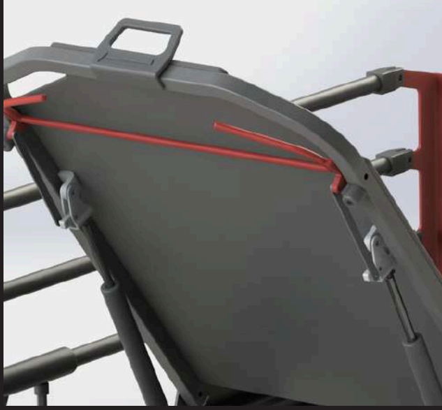
Double Shock Absorber on Back