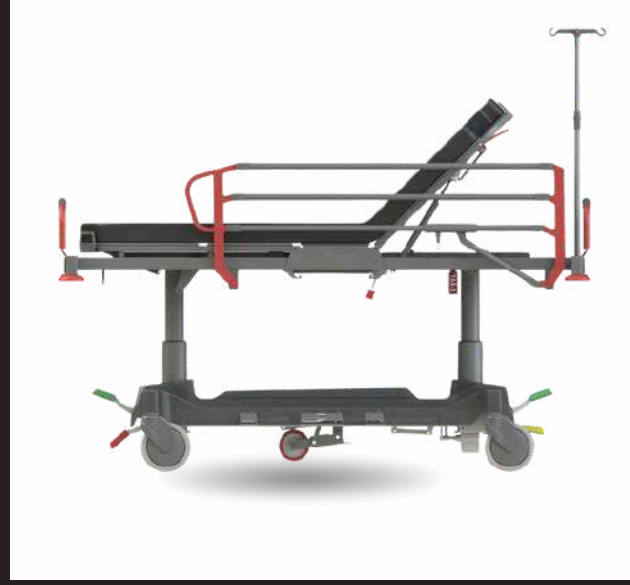
60-90 cm Height Movement